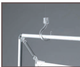
Les fixation aériennes

Pieds stables pour une présentation sur comptoir ou sur table.