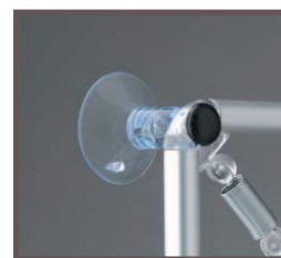
Les fixations en vitrine

Crochet de suspension pour présentation aérienne permettant l'exposition recto-verso.