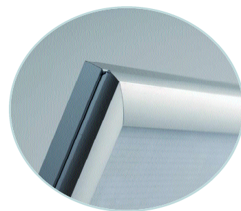
Faible épaisseur du cadre