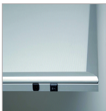
Interrupteur marche / arrêt