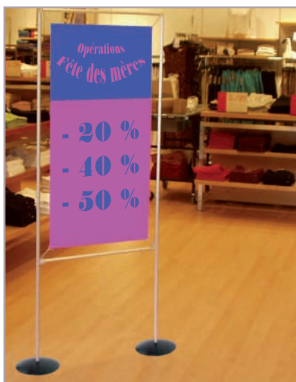
Base platine acier

Elle existe en plusieurs couleurs et s'adapte sur nos 3 modèles de cadres. Visuels visibles recto/verso. Couleur : noir, bleu, vert et transparent.