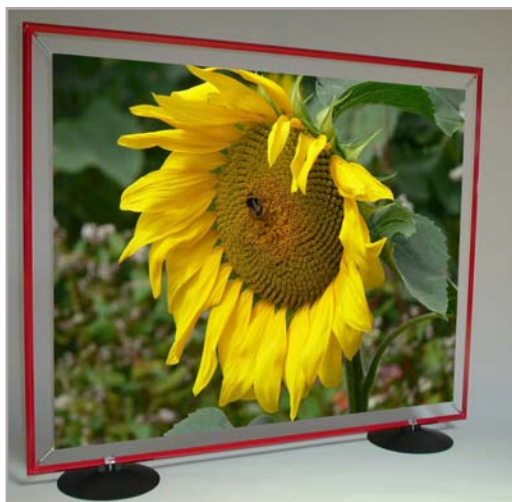
Base plastique ronde

Elle existe en plusieurs couleurs et s'adapte sur nos 3 modèles de cadres. Visuels visibles recto/verso. Couleur : noir, bleu, vert et transparent.